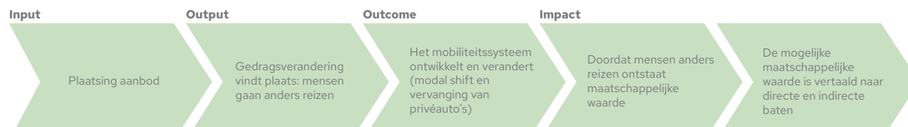
Flowchart: Van modal shift naar maatschappelijke impact

Elk voertuig dat zich bevindt op de openbare weg, draagt een veiligheidsrisico met zich mee 5 . Verschillende modaliteiten hebben afhankelijk van het gebruik en locatie, een verkeersveiligheidsrisico. Als er minder verkeer rijdt of anders wordt gereisd, kan dit effect positief of negatief uitpakken.